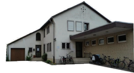
Das Büro der 2. Chance plus befindet sich in Uelzen, in der Luisenstr. 55, im Gebäude des Jugendmigrationsdienstes des CJD Göddenstedt